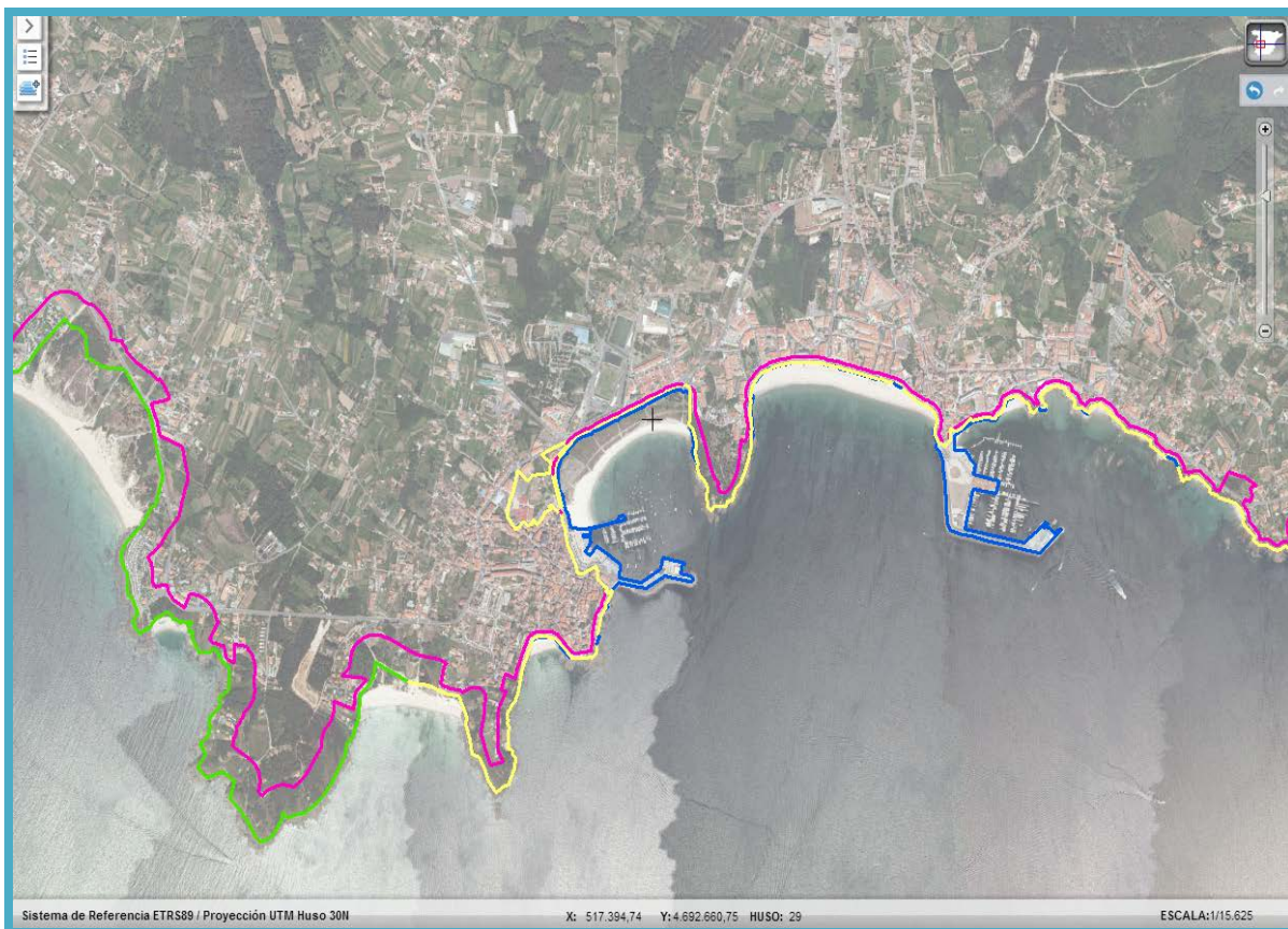
Imagen de detalle de la información del servicio

La cartografía incluida en este servicio contiene las zonas definidas como Deslinde DPMT y su correspondiente información alfanumérica asociada. Así como las zonas de exclusión de determinados núcleos de población y terrenos del dominio público marítimo-terrestre .